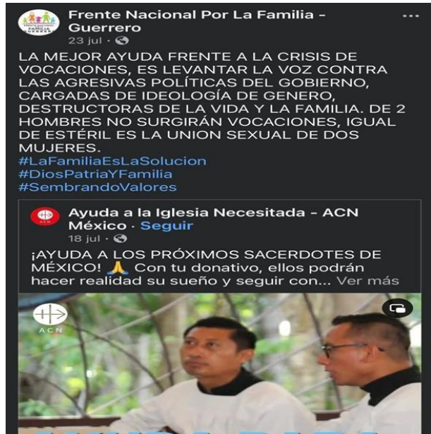
Imagen 6. Captura tomada de Facebook, compartido por FNF- Guerrero

Según el periódico de Guerrero El sur , en el año 2022 este grupo tuvo varias actividades y manifestaciones a fin de exigir que no se aprobara la despenalización del aborto en Guerrero. Participaron con marchas en el Congreso del estado y, asimismo, en conferencias de prensa, mencionaban haber presentado una queja ante la Comisión de Derechos Humanos del Estado de Guerrero contra miembros del Congreso.