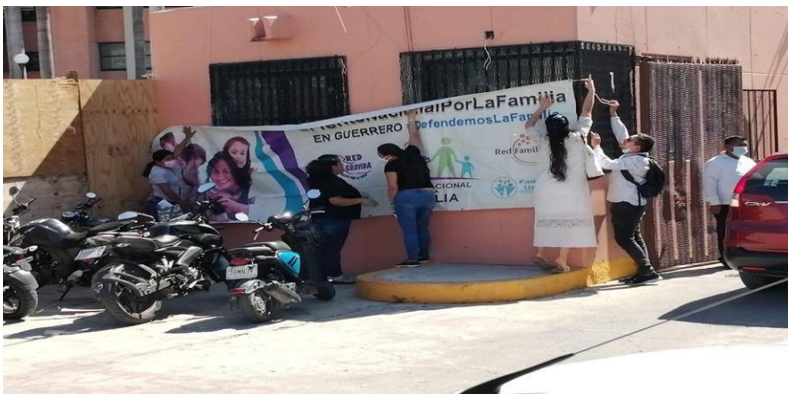
Imagen 3. Grupo Frente Nacional por la Familia Guerrero protestando contra la despenalización de aborto.

2016 con el objetivo de defender lo que denomina familia natural o tradicional y promover ciertos valores particularmente en oposición al matrimonio igualitario, la adopción por parejas del mismo sexo y la legalización del aborto. Este grupo ha liderado marchas y campañas a nivel nacional para influir en políticas públicas, oponiéndose a leyes que perciben como amenaza a los valores familiares y cristianos. En el estado de Guerrero el FNF tiene presencia activa y se visibiliza principalmente en la plataforma Facebook, bajo el nombre de Frente Nacional Por La Familia – Guerrero. Este movimiento es clave dentro de los sectores Provida y promotores de la familia tradicional; utilizan tanto estrategias de movilización social, como lo sugiere la imagen 3).