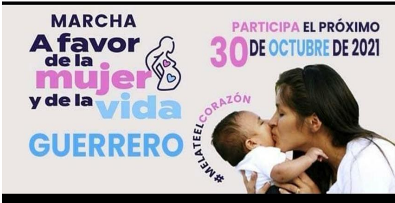
Imagen 4. Foto de portada del Facebook Frente Nacional Por La Familia- Guerrero.

Incluso campañas en redes digitales para ampliar su influencia, ver imagen 4.