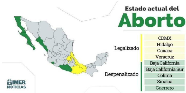
Imagen 2: Distribución del aborto por entidad federativa

Coahuila y Sinaloa (IPAS México, 2022), como lo sugiere la imagen 2.