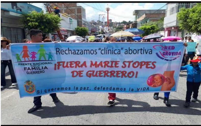
Imagen 7. Foto de portada de la página de Facebook Red Guerrero Por La Vida- Central

asociaciones, secciones y ONG's civiles a favor de la vida en el Estado de Guerrero. Al igual que Frente Nacional Por La Familia- Guerrero comparten posturas contra el aborto y la ideología de género y defienden los valores católicos por lo que estos dos movimientos parecen estar unidos. Ver imagen 7.